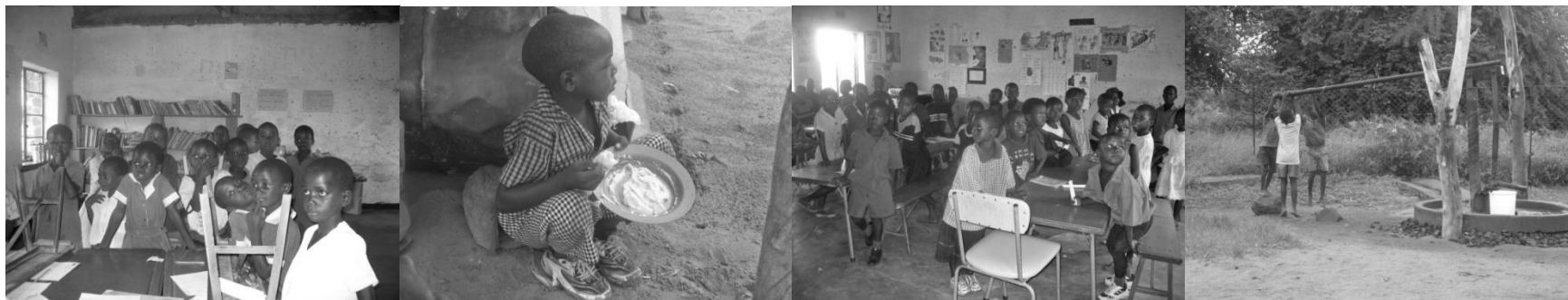
Monde Primary School "bibliotek". EU's hjælpepakke med grød.