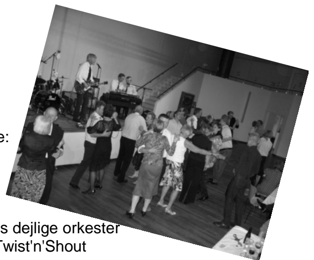
Vores dejlige orkester Twist'n'Shout