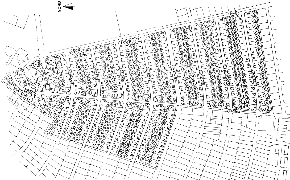
PARCELFORENINGEN TOFTHOLM Matr. nr. 7a og 8a af Skovlunde by

Foreningens anliggender varetages af en bestyrelse på 5 medlemmer, der vælges på generalforsamlingen. Endvidere vælges 2 bestyrelsessuppleanter, 2 revisorer og 1 revisorsuppleant. Valgperioden er 2 år. Genvalg kan finde sted.