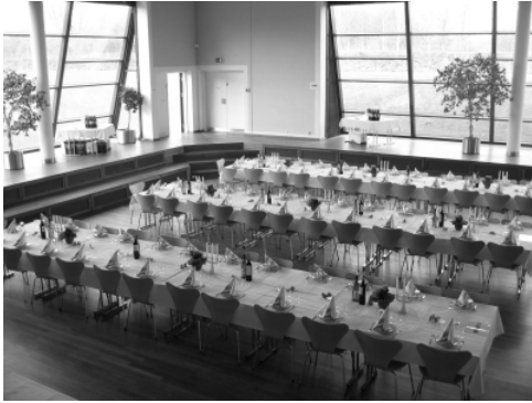
Bordopsætning: 75 personer